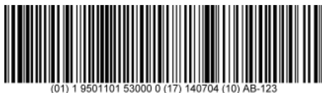
Exemple de code-barres GS1-128